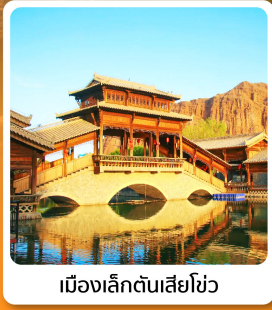
เมืองเล็กตันเสี่ยโซ่ว

อาหารมื้อพิเศษ ไก่ตุ๋นหม้อไอน้ำ ซีโครงหมูสัโตะลิกันโจว