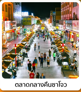
ตลาดกลางคินซาโจว