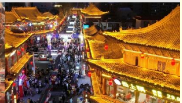
ตลาดกลางคืนจางเย่

*ทางบริษัทฯ ขอสงวนสิทธิ์ในการสลับโปรแกรมทัวร์ตามความเหมาะสมขึ้นอยู่กับสถานการณ์หน้างาน โดยคำนึงถึงผลประโยชน์ของลูกค้าเป็นสำคัญ