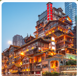
หงหยาดตั้ง

ไฮโล่! อุทยานแห่งชาติหลุมบ่อฟ้า มรดกโลกระดับ 5A รถไฟฟ้าทะลุตึก ตึกตะเกียบ อลังการแสงสีหงหยาดตั้ง