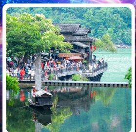
หมู่บ้านชาวน้ำเสี่ยเหรินเจีย