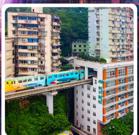
รถไฟฟ้าทะลุтик