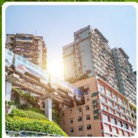
รถไฟฟ้าสุดึก