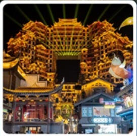
ตึกหัตถจารย์ 72