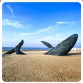
วาฬผู้โดดเดี่ยว