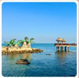
เกาะหย่างหม่า