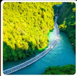
คุบเขาสิงโต