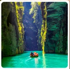
ผิงซานแกรนด์แคนยอน

ไฮไลท์! บินตรงลงเอนซือ เกี้ยวเอนซือเน้นๆจัดเต็มทั่วเมือง คุบเขาสิงโต ผิงซานแกรนด์แคนยอน อุทยานจันลี่ซาน