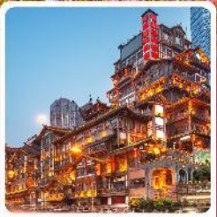
หงหยาดิ่ง