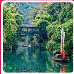
หมู่บ้านชานเสี่ยเหรินเจีย