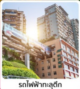
รถไฟฟ้าทะเลติก