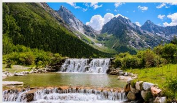
อุทยานแห่งชาติปี่เฟิงโกว