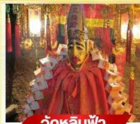
วัดหลิมฟ้า