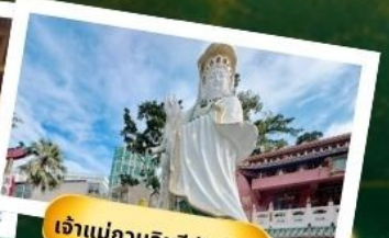
เจ้าแม่กวนอิมริฟลัสเบย์