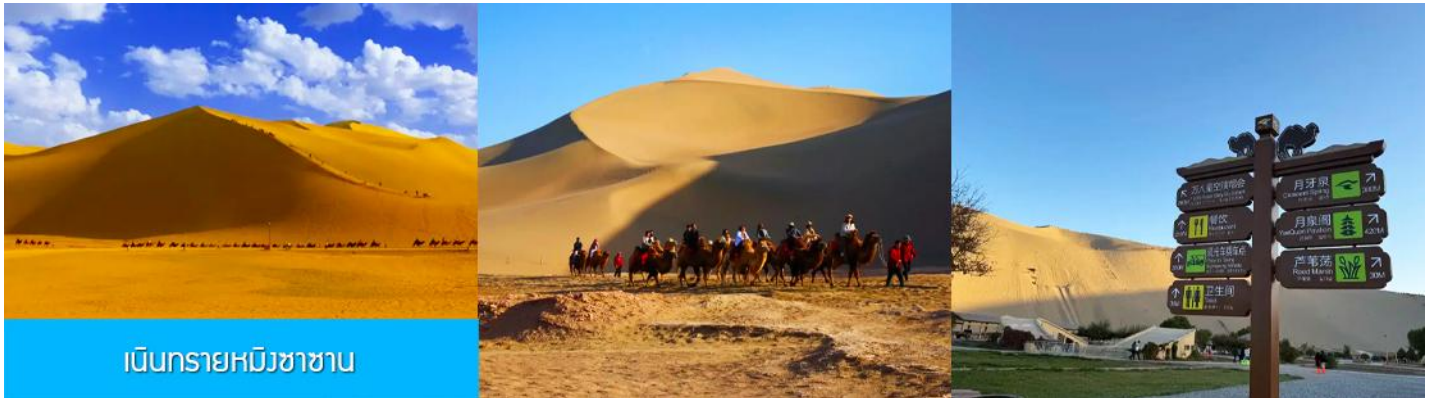
เนินทรายหิงซาซาน