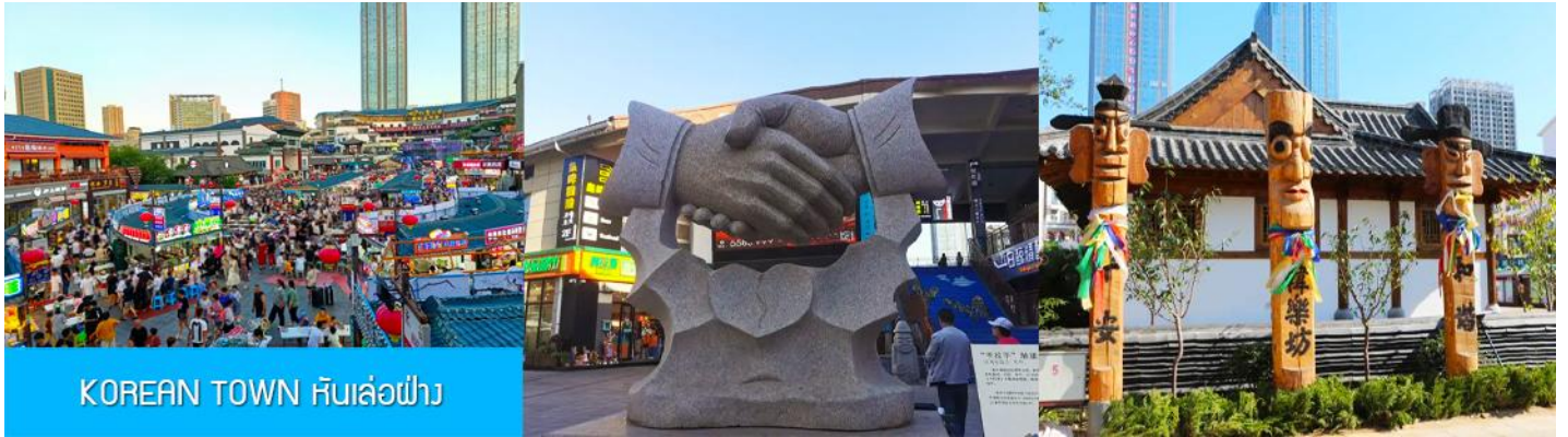
KOREAN TOWN หันเล่อฝาง

จากนั้นนำท่านสู่ ย่านเกาหลี KOREAN TOWN หันเล่อฝาง 韩乐坊 แหล่งท่องเที่ยวระดับ 3A ที่ชุกจนเซ็ป วัฒนธรรมเกาหลีของเมืองเว이하์ ประกอบด้วยถนนคนเดินเกาหลี ประตุน้ำสี่สาย หอเฉลิมฉลอง และจัตุรัส วัฒนธรรมเล่อเทียนที่มีความโดดเด่นด้านสถาปัตยกรรม ให้ท่านได้เดินชม เก็บภาพ ลิ้มรสอาหารพื้นเมืองใน ย่านเกาหลีได้อย่างเต็มอิ่ม..