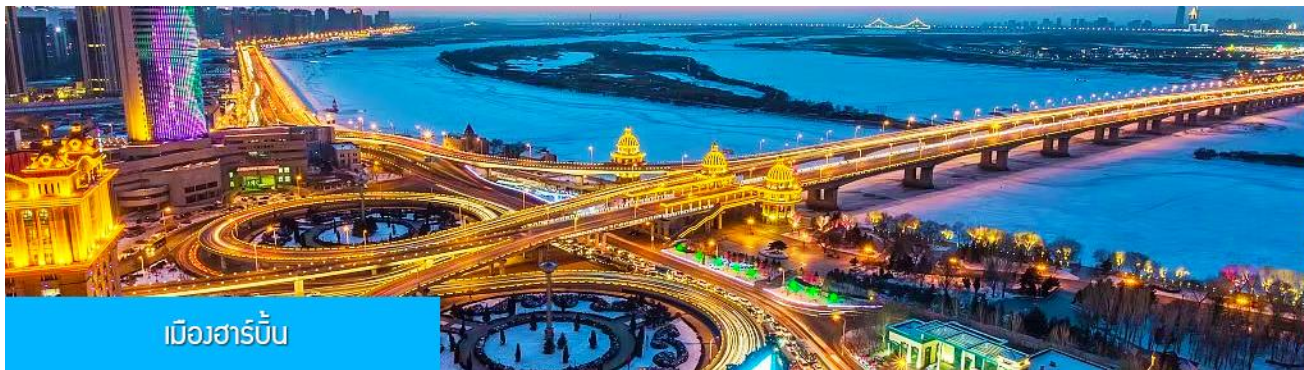
เมืองฮาร์บิน

หลังอาหารนำท่านเดินทางสู่ เมืองฮาร์บิน 哈尔滨市 (ระยะทาง 250 กม.ใช้เวลาเดินทางราว 3 ชั่วโมงเศษ) เมืองฮาร์บินเป็นเมืองที่ตั้งอยู่ทางตอนเหนือของจีนที่มีพรมแดนติดกับประเทศรัสเซีย เป็นเมืองเอกของมณฑลเฮยหลงเจียง มีสมญานามว่าเป็นกรุงมอสโกตะวันออก และได้ชื่อว่าเป็นเมืองหลวงแห่งฤดูหนาวเนื่องจากเมืองแห่งนี้มีช่วงฤดูหนาวยาวกว่าฤดูร้อน มีเทศกาลแกะสลักน้ำแข็งนานาชาติจัดขึ้นที่เมืองนี้ในช่วงฤดูหนาวของทุกปี เป็นจุดหมายปลายทางสำหรับนักท่องเที่ยวทั้งในและต่างประเทศที่ชื่นชอบความสวยงามของหิมะในฤดูหนาว