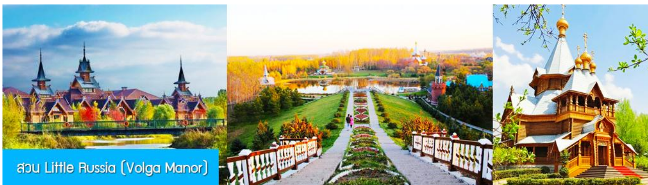
สวน Little Russia (Volga Manor)

หลังอาหารนำท่านเดินทางสู่ เมืองฮาร์บิน 哈尔滨市 (ระยะทาง 250 กม.ใช้เวลาเดินทางราว 3 ชั่วโมงเศษ) เมืองฮาร์บินเป็นเมืองที่ตั้งอยู่ทางตอนเหนือของจีนที่มีพรมแดนติดกับประเทศรัสเซีย เป็นเมืองเอกของมณฑลเฮยหลงเจียง มีสมญานามว่าเป็นกรุงมอสโกตะวันออก และได้ชื่อว่าเป็นเมืองหลวงแห่งฤดูหนาวเนื่องจากเมืองแห่งนี้มีช่วงฤดูหนาวยาวกว่าฤดูร้อน มีเทศกาลแกะสลักน้ำแข็งนานาชาติจัดขึ้นที่เมืองนี้ในช่วงฤดูหนาวของทุกปี เป็นจุดหมายปลายทางสำหรับนักท่องเที่ยวทั้งในและต่างประเทศที่ชื่นชอบความสวยงามของหิมะในฤดูหนาว