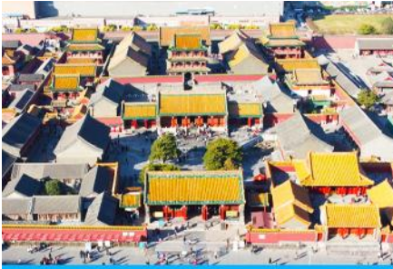
พระราชวังโบราณเสิ่นหยาง

รับประทานอาหารเช้า ณ ห้องอาหารของโรงแรม (4)