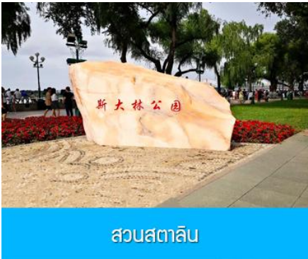
สวนสตาลิน