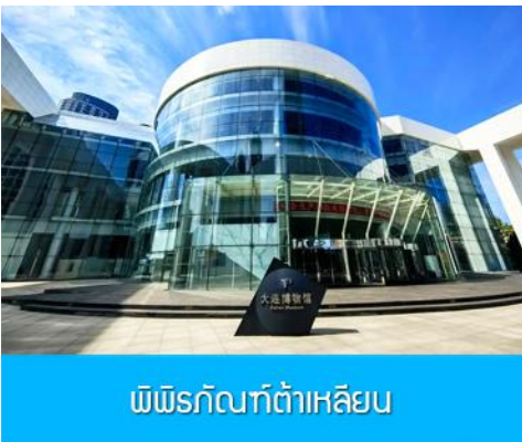
พิพิธภัณฑ์ต้าเหลียน

รับประทานอาหารเช้า ณ ห้องอาหารของโรงแรม (13)