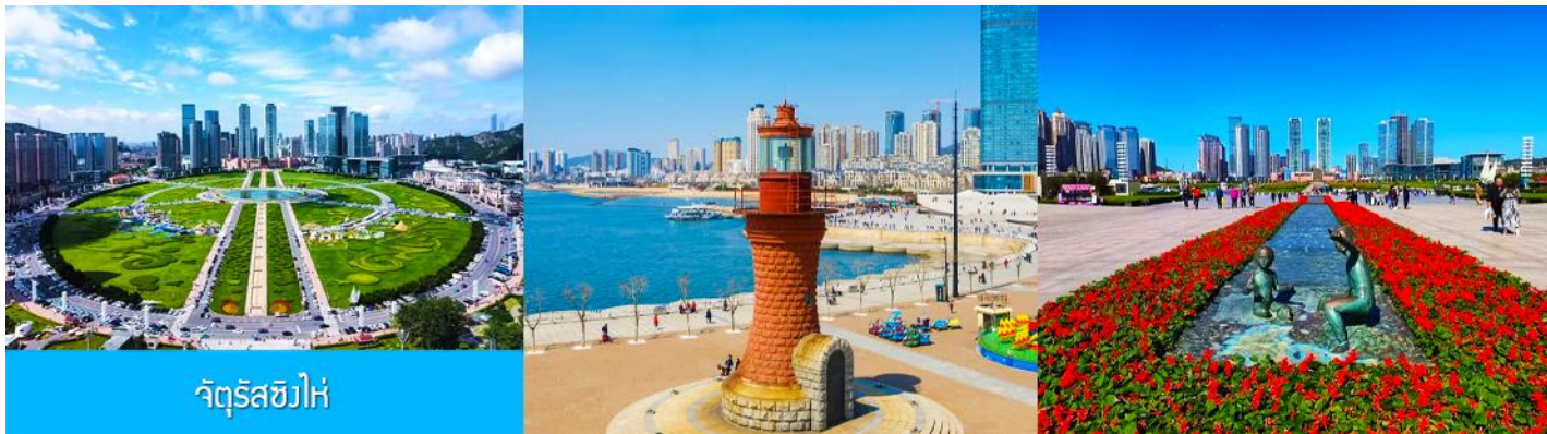
จัตุรัสชิงไห่

นำท่านเที่ยวชม จัตุรัสชิงไห่ 星海广场 เป็นจัตุรัสขนาดใหญ่เป็นแลนด์มาร์คสำคัญของเมืองต้าเหลียน สร้างขึ้นเพื่อเฉลิมฉลองในโอกาสที่รัฐบาลอังกฤษคืนเกาะฮ่องกงในให้จีนในปี ค.ศ. 1997 ตั้งอยู่ชายฝั่งทะเลในเมืองต้าเหลียน เป็นจัตุรัสใจกลางเมืองที่ใหญ่ที่สุดในโลกและเป็นแลนด์มาร์คของเมืองต้าเหลียน รายล้อมด้วยตึกกระจาที่ทันสมัย ภายในมีบ่อน้ำพุดนตรี ลานหญ้าขนาดใหญ่ และลานกว้างสำหรับจัดกิจกรรมกลางแจ้ง อาทิ เทศกาลเบียร์นานาชาติ การแข่งขันวิ่งมาราธอน งานแฟชั่นนานาชาติเมืองต้าเหลียน ฯลฯ