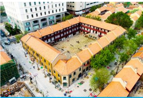
เมืองเก่าเยอรมัน ตรอกกว้างชิงหลี

จากนั้นนำท่านเดินเที่ยวชม ถนนจงซาน 中山路 ถนนที่เต็มไปด้วยกลิ่นอายยุโรป และถนนสายนี้มีบันทึกเรื่องราวมากกว่าศตวรรษของเมืองชิงเต่าไว้ ที่นี่เป็นศูนย์กลางการค้าแห่งแรกที่เต็มไปด้วยสถาปัตยกรรมสไตล์ยุโรปเก่าแก่ที่ได้รับอิทธิพลมาจากเยอรมัน ให้ท่านได้เดินเก็บบรรยากาศ และ เก็บภาพกับ โบสถ์เซนต์ไมเกล (ด้านนอก) โบสถ์แห่งนี้ที่คู่รักนิยมมาถ่ายภาพงานแต่งงานมากที่สุดในเมืองชิงเต่า ให้ท่านถ่ายรูปเก็บภาพ