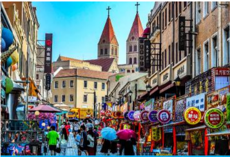
ถนนนางซาน

หลังอาหารนำท่านเดินทางชม สะพานจันเดียว 栈桥 เป็นแลนด์มาร์กแห่งประวัติศาสตร์คู่เมืองชิงเต่า สร้างเมื่อปี ค.ศ.1891 มีลักษณะเป็นสะพานหินทอดยาวกว่า 440 เมตรสู่ทะเล ปลายสะพานมีศาลา ทรงแปดเหลี่ยมสีแดงที่โดดเด่น ซึ่งเป็นสัญลักษณ์บนฉลากเบียร์ชิงเต่า ขึ้นชื่อเรื่องวิวสวย รับลมทะเล ให้ท่านเก็บภาพบรรยากาศ