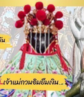
เจ้าแม่กวนอิมยืมเงิน