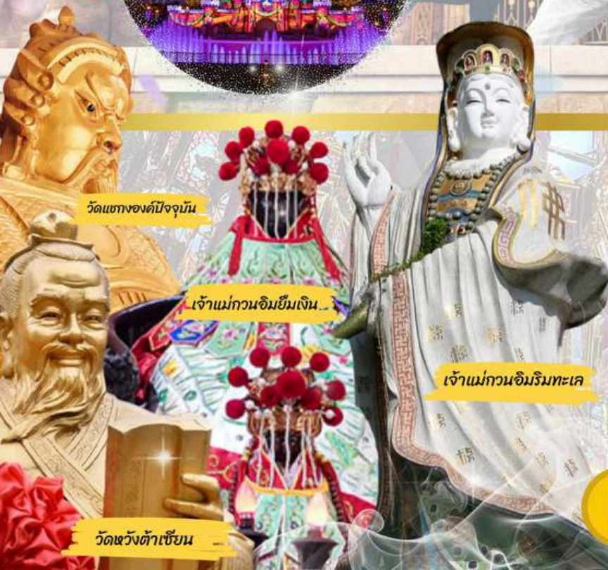
วัดแห่งองค์ปัจจุบัน