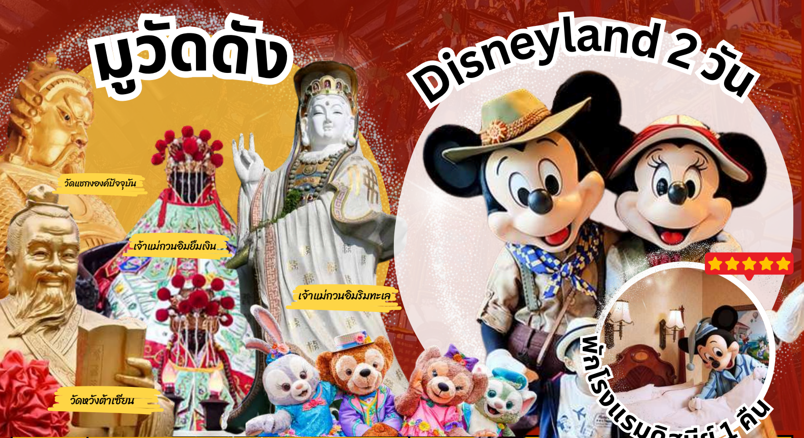
วัดแห่งองค์ปัจจุบัน