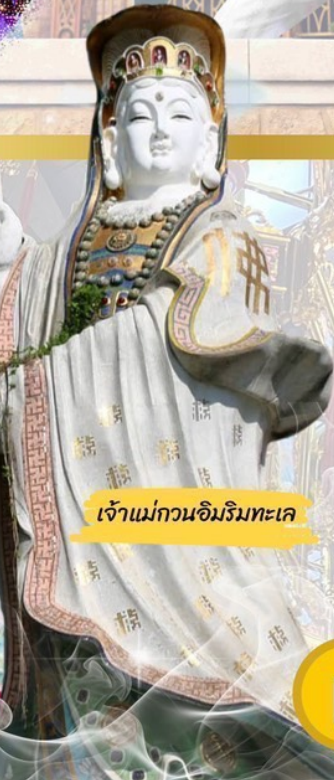
เจ้าแม่กวนอิมวิมทะเล