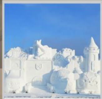
"ASAHIKAWA SNOW FEST"