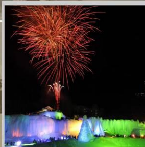
"SOUNKYO ICE FEST"