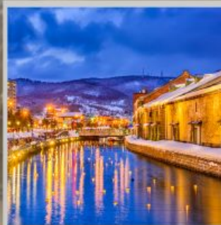
"OTARU CANAL FEST"