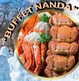
LAKE SHIKOTSU ICE FESTIVAL 2027