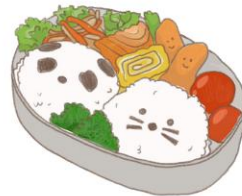
● อาหารสำหรับเด็ก ( 2-11 ปี ) *วัตถุดิบขึ้นอยู่กับทางร้าน