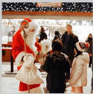
“ODORI GERMAN MARKET”