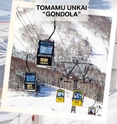
TOMAMU UNKAI “GONDOLA”