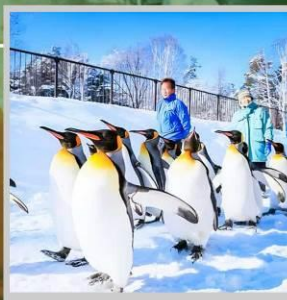
“PENGUIN ASAHIYAMA ZOO”