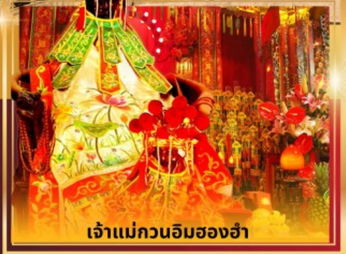
เจ้าแม่กวนอิมของอ่ำ