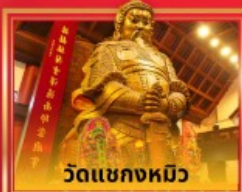
วัดเขangkงหมีว