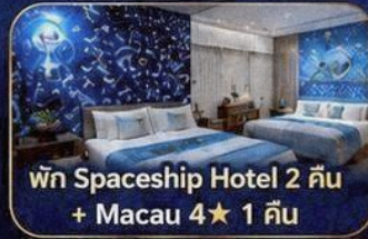
พัก Spaceship Hotel 2 คืน + Macau 4★ 1 คืน