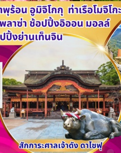
สักการะศาลเจ้าดัง ดาไซฟู