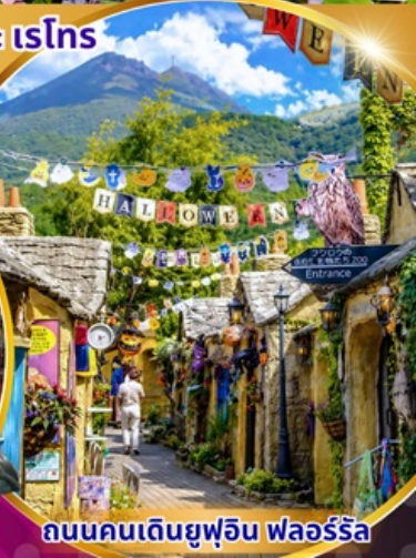
ถนนคนเดินยูฟูอิน ฟลอร์ริล