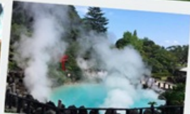
บ่อน้ำพุร้อน เบลปู

หมู่บ้านยูฟูอินฟลอร์ริล ทะเลสาบคินริน ทะเลสาปคินริน บ่อน้ำพุร้อน อุมิจิโกกุ ท่าเรือโมจิโกะ เรโร ตลาดปลาคาราโตะ ศาลเจ้ามียาจิดาเกะ ดิวตี้ฟรี ฟุกุโอกะ เบย์ พลาซ่า ช้อปปิ้งออน มอลล์ หิ้งคูเมโอโตะอิวะ ชมดอกไม้ไฮเดรนเยีย รอบน้ำตกชิราอิโตะ ช้อปปิ้งย่านเท็นจิน