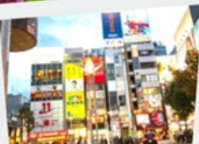
ช้อปปิ้งเทนจิน