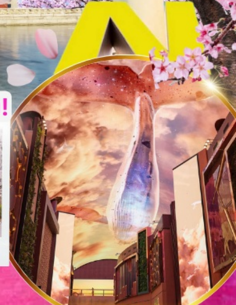
Aurora Media Art

ชมศิลปะดิจิทัลสุดล้ำ บนจอ LED เสมือนจริงขนาดยักษ์ อิสระช้อปปิ้งย่านดัง คังนัม เมียงดง ฮงแด ซองซู ช้อปปลอดภาษี Lotte Duty Free