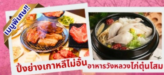
ปิ้งย่างเกาหลีไม่อื่น อาหารวังหลวงไก่ตุ๋นโสม

เชคอินเกาะนามิ สุดโรแมนติก ชมศิลปะดิจิตอลสุดล้ำ บจจ LED เสมือนจริงขนาดยักษ์ สนุกสุดมันส์ สวนสนุกเอเวอร์แลนด์ อิสระช้อปปิ้ง 2ย่านดัง เมียงดง ฮงแด ช้อปปิ้งปลอดภาษี Lotte Duty Free