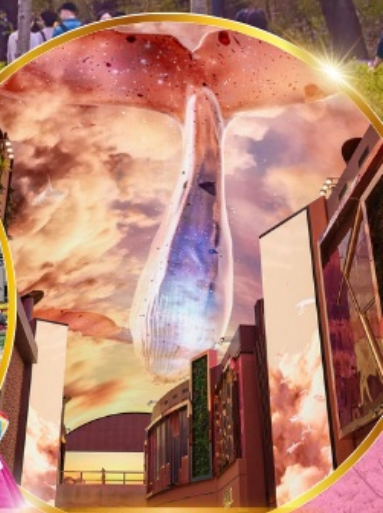
Aurora Media Art

เชคอินเกาะนามิ สุดโรแมนติก ชมศิลปะดิจิตอลสุดล้ำ บจจ LED เสมือนจริงขนาดยักษ์ สนุกสุดมันส์ สวนสนุกเอเวอร์แลนด์ อิสระช้อปปิ้ง 2ย่านดัง เมียงดง ฮงแด ช้อปปิ้งปลอดภาษี Lotte Duty Free