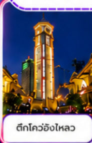
ตึกโควอชิงไหลว