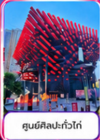
ศูนย์ศิลปะแก้วโก