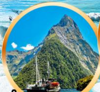
นั่งเรือชมความงาม พยอร์ดแห่ง มิลฟอร์ด ซาวด์