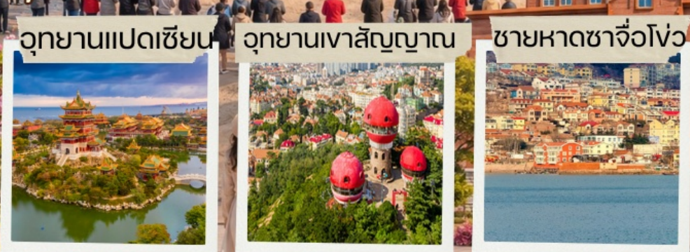
อุทยานแปดเซียน

พิพิธภัณฑ์เป็ชชิงเต่า สะพานจันเฉียว ซากเรือซึกษ์บลูวิส อุทยานแปดเซียนข้ามทะเล ประติมากรรมปลาเวฬุเกยตื้น