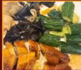
ไก่ แดงกวาง เห็ดหูหนู