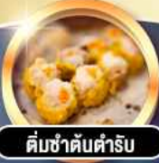
ต้มซ่าต้นตำรับ

гаринди! พักหรู 4 ดาว THE KOWLOON HOTEL ติดถนนนาธาน ย่านช้อปปิ้งจิมซาจอย