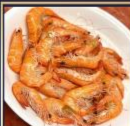
กุ้งหวานลวก