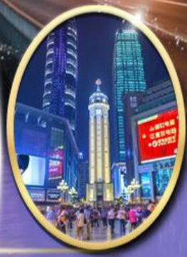
ถนนคนเดินเจี๋ยฟางเป่ย์