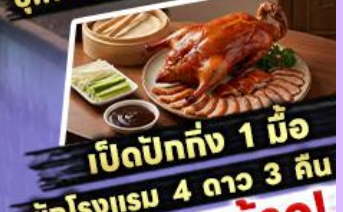
เปิดปากถึง 1 มื้อ

พักรูม 4 ดาว 3 คืน ไฮไลท์ สุดว้าว! ขึ้นลิฟต์แก้วชมความอลังการ กลางหุบเขา