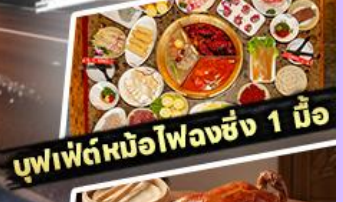
บุฟเฟ่ต์หนือโฝวงซิง 1 มื้อ