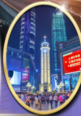
ถนนคนเดินเจียฟางเป็ย