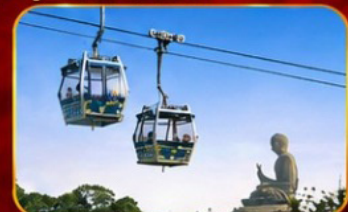
กระเช้านองปีง