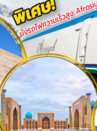
จัตุรัสเรจิสถาน