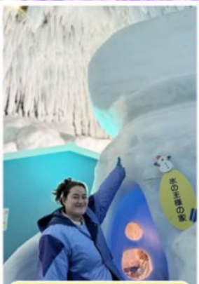
พิพิธภัณฑ์น้ำแข็ง