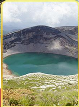
ปากปล่องภูเขาไฟซาโอ