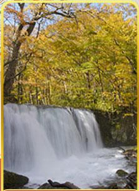
ลำธารโออิราเสะ