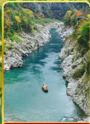
ส่องเรือช่องเขาโอโมเคะ