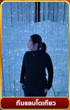
ทีมแอปโตเกียว