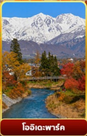
โออิเดะพาร์ค