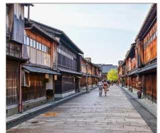
ย่านโรงน้ำชาอิงาชิยามะ

THAI สายการบินไทย บริการทุกระดับประทับใจ FULL SERVICE