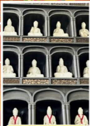
วัดไดชิซังเซโอดิจิ