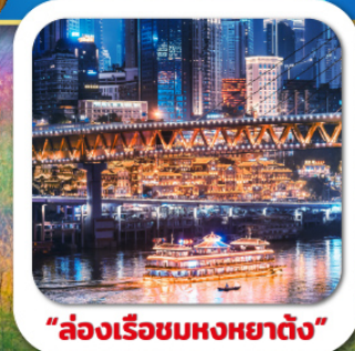
"ล่องเรือชมหงหยาดัง"