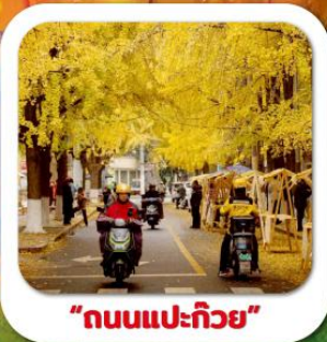
"ถนนแปะก๊วย"

นั่งกระเช้าชมภูเขาหวงอู่ซาน ขุนเขาใบไม้แดงอันดับหนึ่งของประเทศจีน เมืองชู่หนิง วัดหลิงจวน (วัดเจ้าแม่กวนอิมกะพริบตา) - พาสินแกะสลักต้าจู้ หงหยาดัง ถนนแปะก๊วย ตึกตะเกียบ วัดหลัวซัน ล่องเรือชมวิวฉงชิ่ง