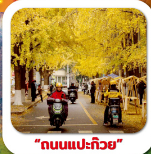
"ถนนแปะก๊วย"