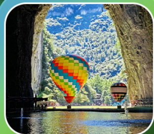
“ถ้าถึงหลง”

เที่ยวจีน 2 มณฑล เสฉวน+หูเป่ย์ (เมืองหลงซิ่ง+เมืองเอินฉือ) • ถ้าถึงหลง ล่องเรือมังกรก้งสู่ยชมวิวยามค่ำคืน • ผิงซานแกรนด์แคนยอน (รวมล่องเรือ) หงหยาดัง • วัลหลิวอัน • ถนนคนเดินเจียฟางเป่ย์ • ตึกตะเกียบ