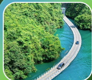
“หุบเขาสิงโต ซื่อจื่อกวน”