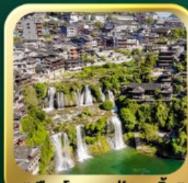
"เมืองโบราณฟูหลงเจิน"