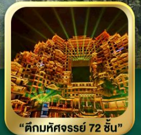
"ตึกมหัศจรรย์ 72 ชั้น"