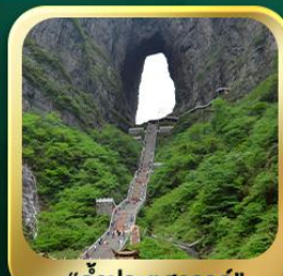
"กำแพงประตูสวรรค์"