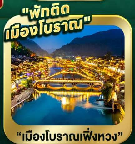
"พักติด เมืองโบราณ"