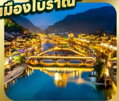
"เมืองโบราณเฟิ่งหวง"