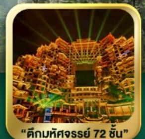
"ตึกมหัศจรรย์ 72 ชั้น"

นั่งกระเช้าชมภูเขาเทียนเหมินซาน • กำประตูล่องเรือ • ทางเดินกระจก เมืองโบราณเฟิ่งหวง • เมืองโบราณฟูหลงเจิน • ชมโซ่วจิ้งจอกขาว ภูเขาเทียนจื่อซาน (รวมลิฟต์แก้ว) • หุบเขาอวตาร • ตึกมหัศจรรย์ 72 ชั้น