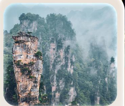
“หุบเขาอวตาร”