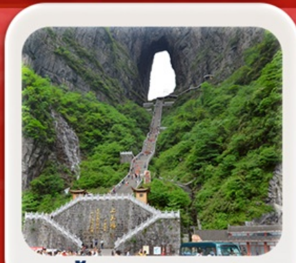
“กำประตูลิ่วหวง”