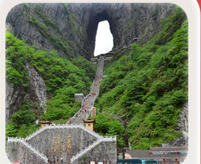
“กำแพงคู่สวรรค์”