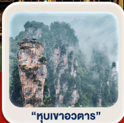
“หุบเขาอวตาร”