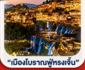
“เมืองโบราณฟู่หลงเจิน”