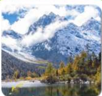
"ปี่เฟิ่งโกว"

ชมความงาม 2 อุทยาน • สัตรีณี ของเฉียวโกว • ปี่เฟิ่งโกว • พระใหญ่เล่อซาน สะพานหนานเจียว น้ำตาสีฟ้า • ห้องสมุดสุดเก๋ จงซูเก๋ • แพนด้ายักษ์ฉินอันเซลฟี ชอยกว้างชอยแคบ • ถนนคนเดินชุนซีส์ • แพนด้ายักษ์บีบีตีก • ถนนคนเดินฉินหลี่