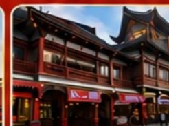
ถนนหวังฝูจิ่ง