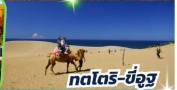
ทตโตริ-ซ็องสุ