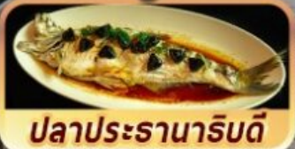
ปลาประธารานาธิบดี