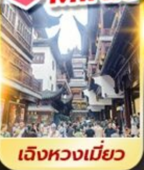
เจียงหวงเมี่ยว