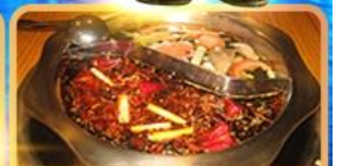
สุกี้ท้องถิ่น