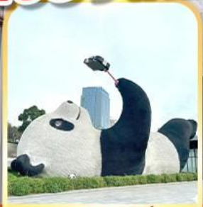
แพนด้าเซลฟ์