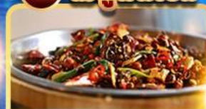
อาหารเสฉวน