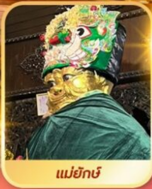
แม่ยักษ์