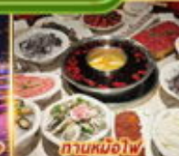
ทานหม้อไฟ