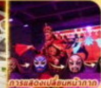
การแสดงเปลี่ยนหน้ากาก