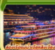
ส่องเมืองยามค่ำคืนที่ลี้ลับ