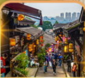
หมู่บ้านโบราณฉือชี่เซว